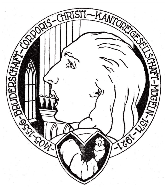
Abbildung: Emblem zum Kantorei-Jubiläum 1921

Erkrankte, sowie Hinterbliebene von verstorbenen Mitgliedern der Kantorei wurden finanziell unterstützt. Selbst die Gewährung von kleinen Krediten war möglich. Im Gegensatz dazu wurde Zuspätkommen oder unerlaubtes Fehlen bei Proben oder Aufführungen mit einer saftigen Geldstrafe belegt. Im Archiv der Kantorei lagern musikhistorische Schätze, so Noten und Abschriften von G. F. Hän-